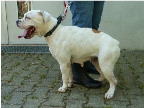
Kyra mit kyphotische Verkrümmung der Wirbelsäule

Kyra zeigte mir bei der „Gangbildanalyse“ ein langsames und vorrobendes Ablegen oder Niederfallen. Der Rücken schwingt beim Laufen nicht mit. Es kommt zum Teil schon zu einem Trippelnden Gang. Im Stand ist die kyphotische Verkrümmung der Wirbelsäule sehr deutlich zu erkennen.