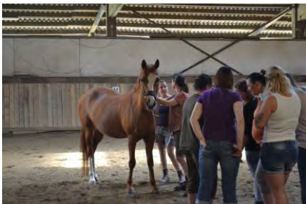
Praxis ist bei uns sehr wichtig und steht nicht nur auf dem Papier. An sehr vielen Unterrichtswochenende ist Praxis dabei

Die Dozenten der SGH Schule sind alle langjährigen praktizierenden Therapeuten, die sich vorgenommen haben dies alte Tradition zu erhalten. Sie geben all ihr erworbenes Wissen und die Praxiserfahrung gern an die Schüler weiter.