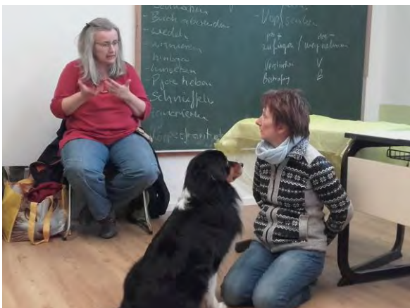
Hunde zu verstehen lernen.

Das Spektrum des THPs ist weit gefächert, es umfasst die klassische Homöopathie, Phytotherapie, Akupunktur, über die Blutegeltherapie, Bachblüten, bis hin zur Beratung zu Haltung und Ernährung. Es ist eher eine „Berufung“ als ein Beruf, da meist eine besondere Verbindung zu Tieren besteht.