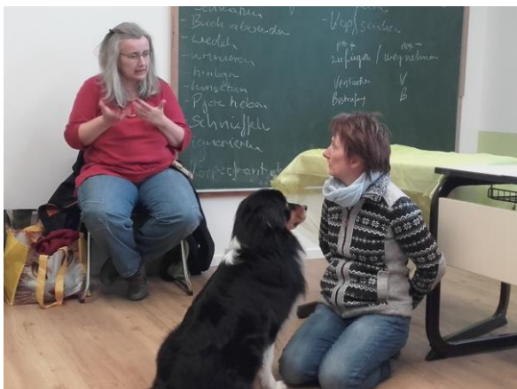
Hunde zu verstehen lernen.

Das Spektrum des THPs ist weit gefächert, es umfasst die klassische Homöopathie, Phytotherapie, Akupunktur, über die Blutegeltherapie, Bachblüten, bis hin zur Beratung zu Haltung und Ernährung. Es ist eher eine „Berufung“ als ein Beruf, da meist eine besondere Verbindung zu Tieren besteht.