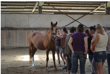
Praxis ist bei uns sehr wichtig und steht nicht nur auf dem Papier. An sehr vielen Unterrichtswochenende ist Praxis dabei

Die Dozenten der SGH Schule sind alle langjährige praktizierende Therapeuten, die sich vorgenommen haben dies alte Tradition zu erhalten. Sie geben all ihr erworbenes Wissen und die Praxiserfahrung gern an die Schüler weiter.