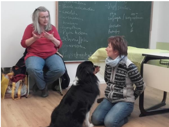
Hunde zu verstehen lernen.

Das Spektrum des THPs ist weit gefächert, es umfasst die klassische Homöopathie, Phytotherapie, Akupunktur, über die Blutegeltherapie, Bachblüten, bis hin zur Beratung zu Haltung und Ernährung. Es ist eher eine „Berufung“ als ein Beruf, da meist eine besondere Verbindung zu Tieren besteht.