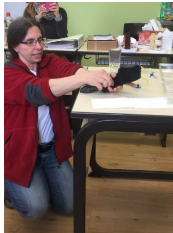
Umgang mit Injektionen. Geübt wird, ganz nach Tierschutzgesetz, an der künstlichen Hundepfote

Die Schüler erwerben in unserer Ausbildung auch den s.g. Spritzenschein. D. h. es wird der richtige Umgang mit Injektionen in Theorie und Praxis gezeigt. Um mit dem Tierschutzgesetz nicht zu kollidieren werden Injektionstechniken an einem Modell gezeigt und können damit auch geübt werden.