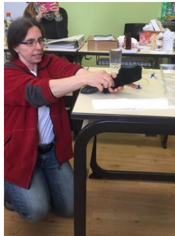
Umgang mit Injektionen. Geübt wird, ganz nach Tierschutzgesetz, an der künstlichen Hundepfote

Inhalte der Ausbildung zum Tierheilpraktiker geht über 42 Wochenenden mit den Inhalten Anatomie, Physiologie und Pathologie der Tierarten Hund, Katze, Pferd, Kleintiere und Wiederkäuer, sowie Anamnese und Untersuchungen. Rechtliche und organisatorische Bereiche gehören ebenso dazu, wie das Lesen von Laborbefunden oder des Krankenberichts des Tierarztes. Die Schüler erwerben in unserer Ausbildung auch den s.g. Spritzenschein. D. h. es wird der richtige Umgang mit Injektionen in Theorie und Praxis gezeigt. Um mit dem Tierschutzgesetz nicht zu kollidieren werden Injektionstechniken an einem Modell gezeigt und können damit auch geübt werden.