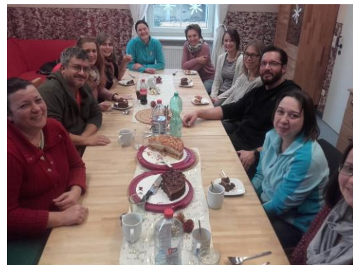
und nach getaner Arbeit die wohlverdiente Pause

.....bis zum II. Untersuchungswochenende