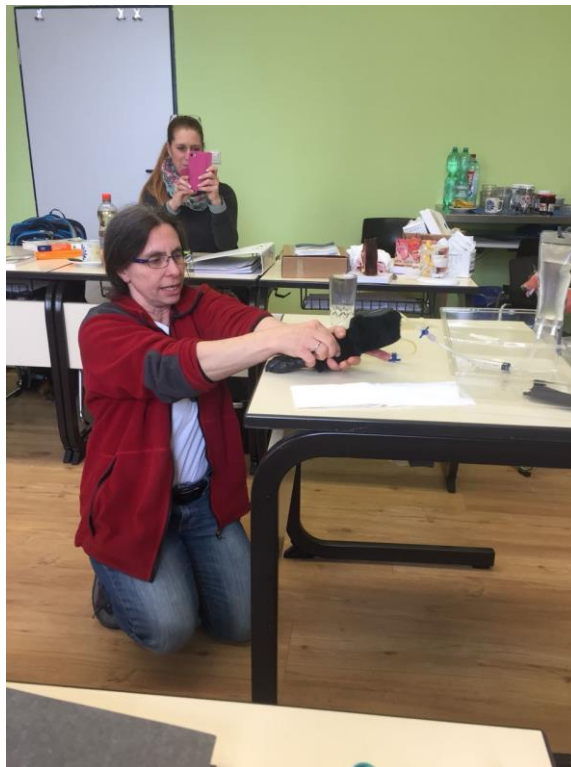
Umgang mit Injektionen

Inhalte der Ausbildung zum Tierheilpraktiker geht über 42 Wochenenden mit den Inhalten Anatomie, Physiologie und Pathologie der Tierarten Hund, Katze, Pferd, Kleintiere und Wiederkäuer, sowie Anamnese und Untersuchungen. Rechtliche und organisatorische Bereiche gehören ebenso dazu, wie das Lesen von Laborbefunden oder des Krankenberichts des Tierarztes. Die Schüler erwerben in unserer Ausbildung auch den s.g. Spritzenschein. D. h. es wird der richtige Umgang mit Injektionen in Theorie und Praxis gezeigt.