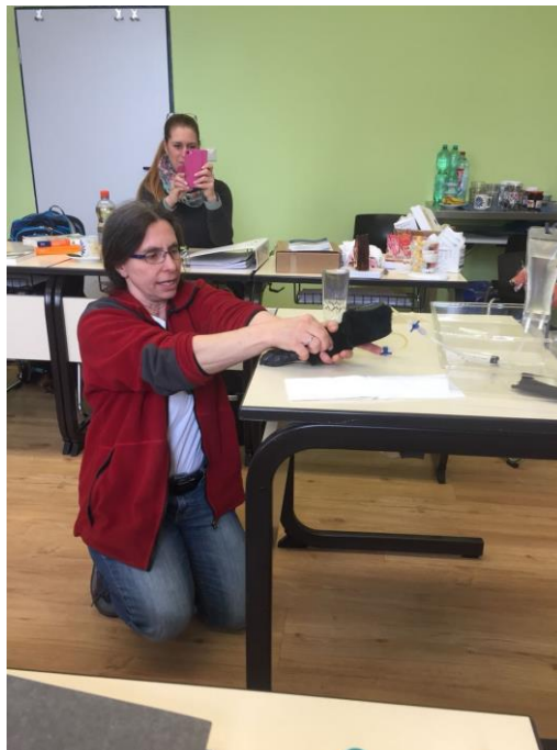
Umgang mit Injektionen

Inhalte der Ausbildung zum Tierheilpraktiker geht über 42 Wochenenden mit den Inhalten Anatomie, Physiologie und Pathologie der Tierarten Hund, Katze, Pferd, Kleintiere und Wiederkäuer, sowie Anamnese und Untersuchungen. Rechtliche und organisatorische Bereiche gehören ebenso dazu, wie das Lesen von Laborbefunden oder des Krankenberichts des Tierarztes. Die Schüler erwerben in unserer Ausbildung auch den s.g. Spritzenschein. D. h. es wird der richtige Umgang mit Injektionen in Theorie und Praxis gezeigt.