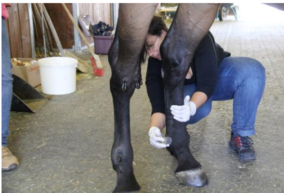
Blutegel – Therapie am Pferd

Das Spektrum des THPs ist weit gefächert, es umfasst die klassische Homöopathie, Phytotherapie, Akupunktur, über die Blutegeltherapie, Bachblüten, bis hin zur Beratung zu Haltung und Ernährung. Es ist eher eine „Berufung“ als ein Beruf, da meist eine besondere Verbindung zu Tieren besteht.