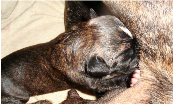
Boxerhündin Shanty mit Welpen.

Nach 2 Minuten haben vitale Welpen eine normale Atmung und geben Töne von sich