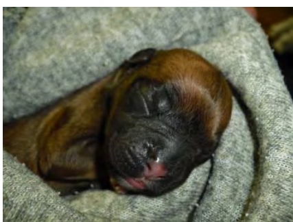
Gina's 1. Welpen nach der Geburt

CAVE: Während der Geburt sollte die Hündin zwar überwacht aber nicht gestört werden. Eine verzögerte Austreibungsphase führt zu einer zunehmenden Mortalität der noch nicht geborenen Welpen