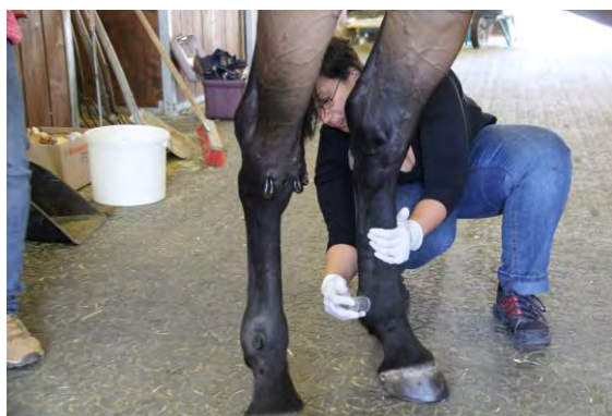
Blutegel – Therapie am Pferd

Es ist eher eine „Berufung“ als ein Beruf, da meist eine besondere Verbindung zu Tieren besteht.