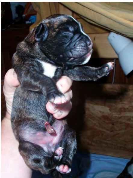
Welpen 1 mit gut versorgtem Nabel.

Der Nabel des Welpen wird mit einer Jodlösung desinfiziert. Sollte es zu einer Nabelblutung kommen ist es notwendig mit einer Klemme die Blutung zu stoppen.