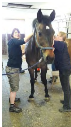
Wellness fürs Pferd