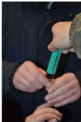
Umgang mit Injektionen

Inhalte der Ausbildung zum Tierheilpraktiker geht über 42 Wochenenden mit den Inhalten Anatomie, Physiologie und Pathologie der Tierarten Hund, Katze, Pferd, Kleintiere und Wiederkäuer, sowie Anamnese und Untersuchungen. Rechtliche und organisatorische Bereiche gehören ebenso dazu, wie das Lesen von Laborbefunden oder des Krankenberichts des Tierarztes. Die Schüler erwerben in unserer Ausbildung auch den s.g. Spritzenschein. D. h. es wird der richtige Umgang mit Injektionen in Theorie und Praxis gezeigt.